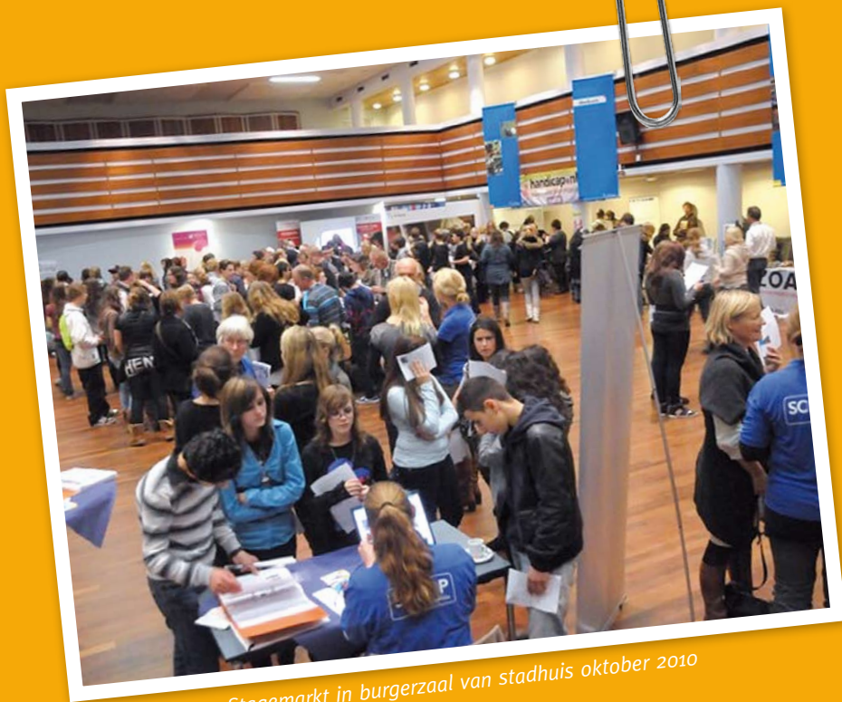
Stagemarkt in burgerzaal van stadhuis oktober 2010